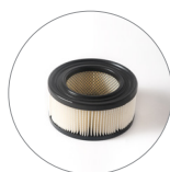
Filtro a cartuccia (versione FC)