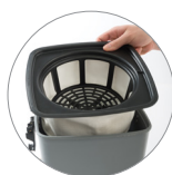
Filtro poliestere (versione FT)