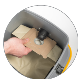
Sacchetto in carta ecologica