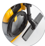
Nuovo sostegno accessori e cavo