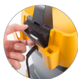
Sistema di filtraggio aria di scarico